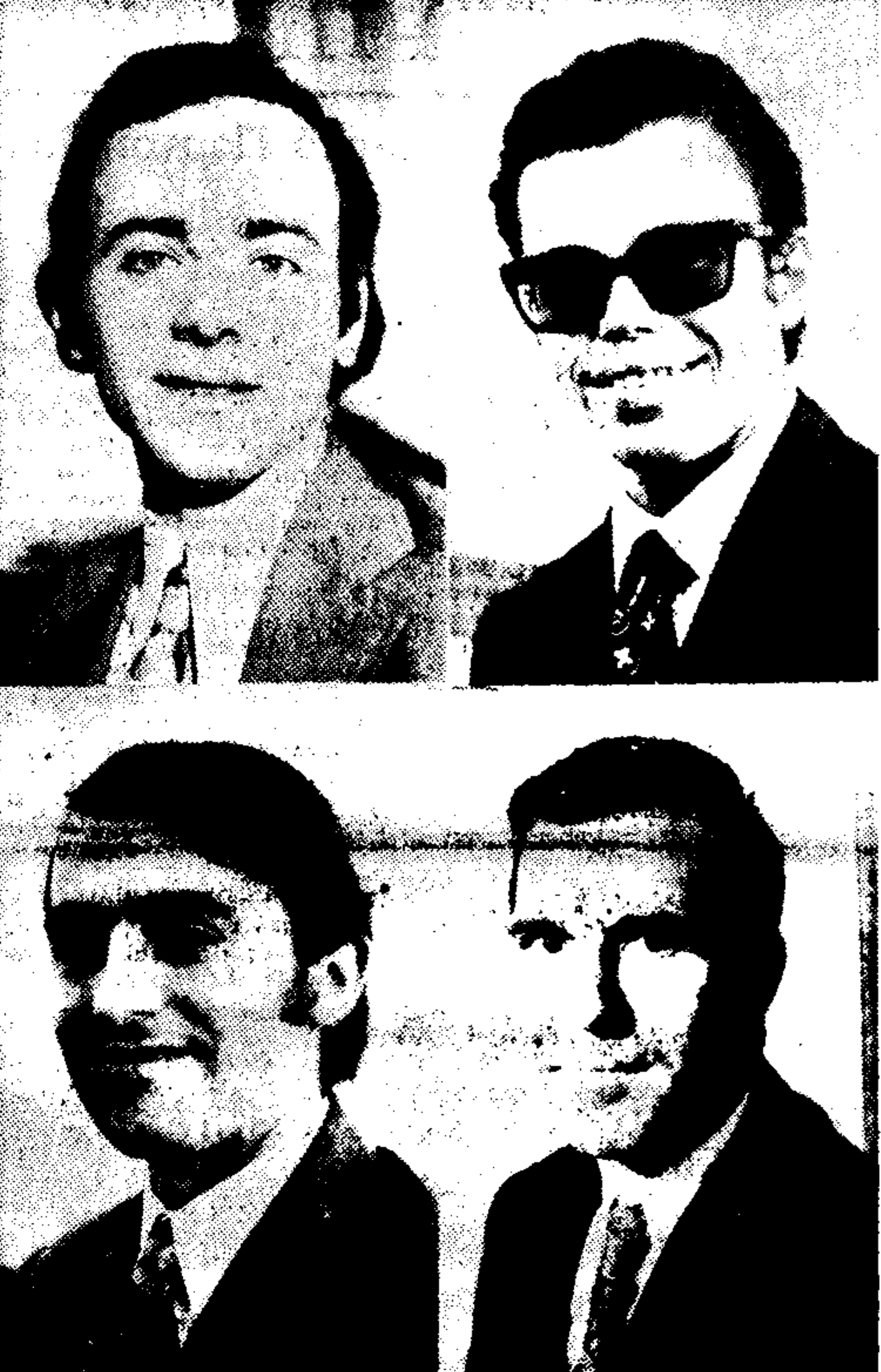
Οι καταδικασθέντες από το Έκτακτο Στρατοδικείο Αθηνών...