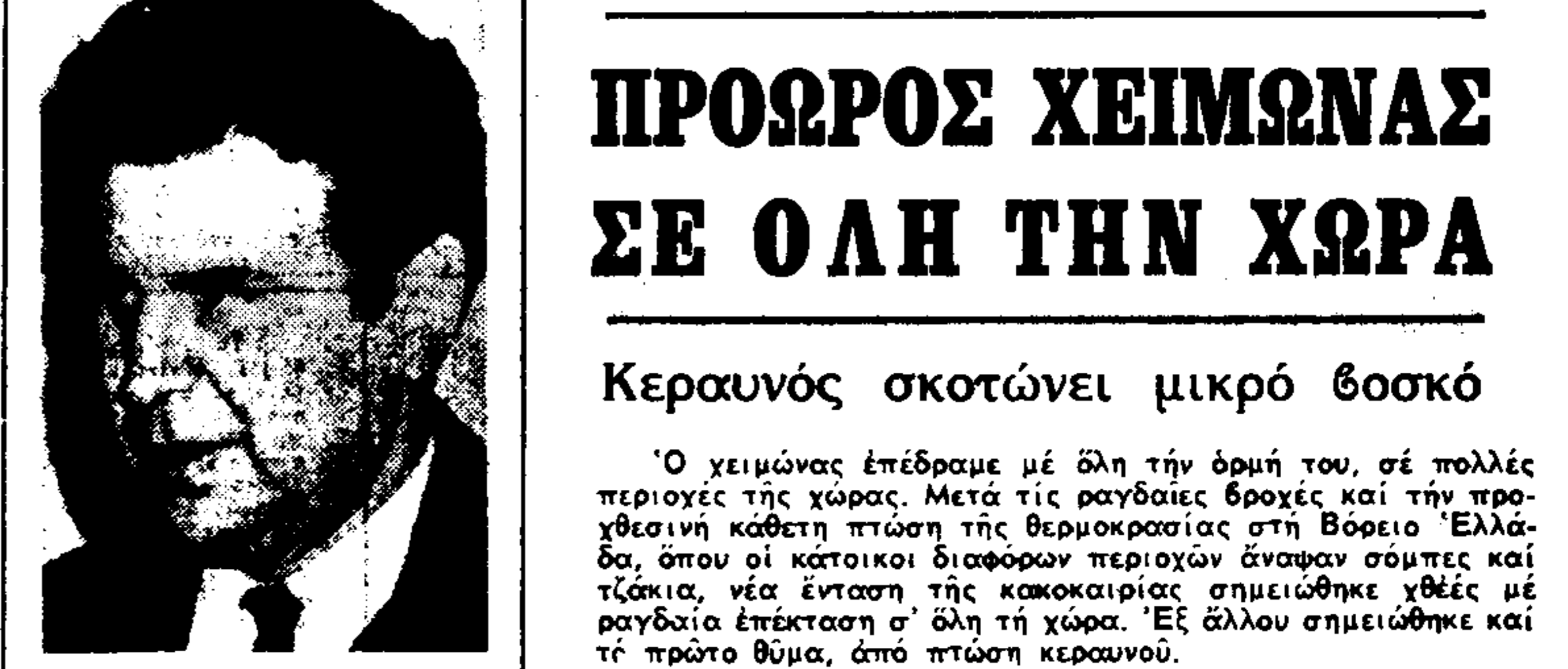
Ο Μίκης Θεοδωράκης